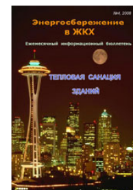
Ежемесячный бюллетень "Энергосбережение в ЖКХ"